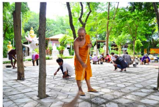
รูปที่ 5 แผ่นพื้นจากการนำคอนกรีตที่เหลือไปใช้ วัดใหม่ศรีสมบุญ จังหวัดสุโขทัย [10]

4.2.2 R2.Reuse การนำกากคอนกรีตที่เหลือจากการทดสอบคุณภาพคอนกรีต โดยวิธีชัก Slump กลับมาใช้ใหม่ โดย ทำเป็นผลิตภัณฑ์อื่น เช่น แผ่นพื้น กระถางปลูกต้นไม้ โต๊ะ เก้าอี้ ซึ่งจะมีการแบ่งตามอายุของคอนกรีตที่เหลือมาและจัดสรรว่าจะนำไปทำผลิตภัณฑ์ใดจึงมีความเหมาะสม ซึ่งนอกจากจะได้ประโยชน์ในเรื่องของการนำของที่จะเสียกลับมาใช้ประโยชน์ และสร้างมูลค่าเพิ่มแล้ว ยังสามารถนำไปช่วยเหลือ หรือมอบให้แก่ชุมชน วัด โรงเรียน เพื่อพัฒนาพื้นที่รอบๆ ให้มีความน่าอยู่มากขึ้น ตามรูปที่ 5 และ รูปที่ 6