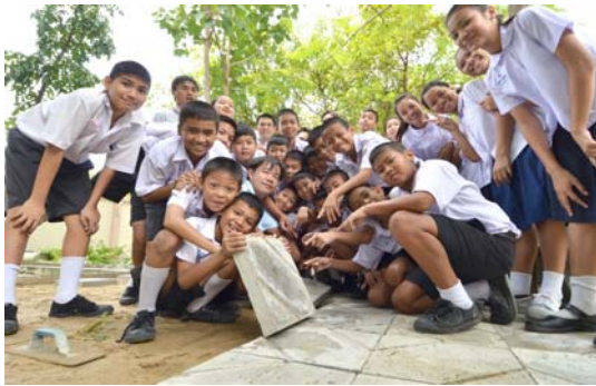
รูปที่ 6 แผ่นพื้นจากการนำคอนกรีตที่เหลือไปใช้ในบริเวณโรงเรียน [10]

4.2.3 R3.Recycle การนำกากคอนกรีตมาเข้ากระบวนการแยกหิน ทราย น้ำ และ นำกลับมาหมุนเวียนใช้ในการผลิตใหม่ เพื่อลดปริมาณกากคอนกรีตที่ต้องกำจัด ในกรณีนี้ต้องทำการทดสอบมวลรวม ได้แก่ หิน และ ทรายที่ได้จากการกระบวนการคัดแยกเพื่อนำกลับมาใช้ใหม่