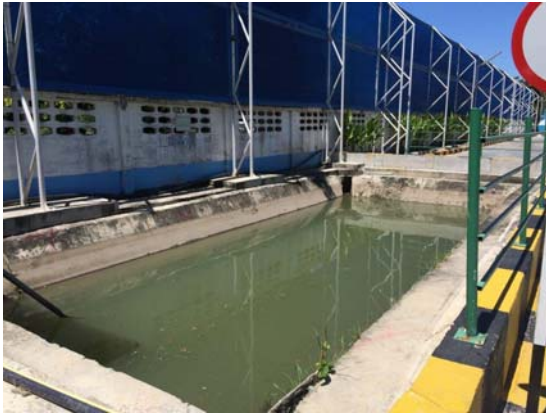
รูปที่ 3 บ่อคายกากคอนกรีต