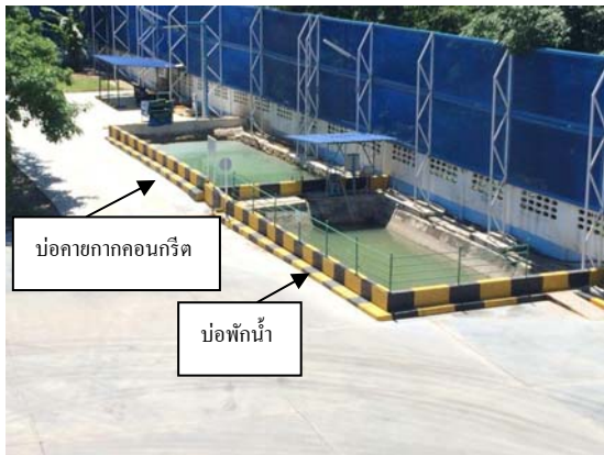
รูปที่ 4 บ่อพักน้ำและบ่อคายกากคอนกรีต

ปัจจุบันค่าใช้จ่ายในการนำกากคอนกรีตจากบ่อคายกากคอนกรีต ตามรูปที่ 3 และ รูปที่ 4 ไปยังสถานที่ฝังกลบ ระยะทางอยู่ระหว่าง 1 - 50 กิโลเมตร ค่าใช้จ่ายอยู่ที่ประมาณ 20,000 บาท ต่อ 1 เที่ยว (น้ำหนักของกากคอนกรีตประมาณ 15 ตัน/เที่ยว กรณีใช้รถบรรทุก 10 ล้อในการขนย้าย)