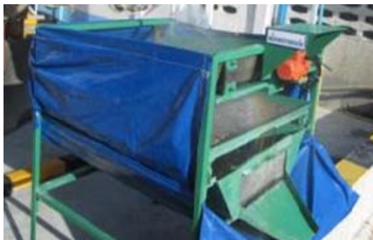
รูปที่ 7 กากคอนกรีตมาเข้ากระบวนการแยกหิน ทราย น้ำ [10]

4.2.3 R3.Recycle การนำกากคอนกรีตมาเข้ากระบวนการแยกหิน ทราย น้ำ และ นำกลับมาหมุนเวียนใช้ในการผลิตใหม่ เพื่อลดปริมาณกากคอนกรีตที่ต้องกำจัด ในกรณีนี้ต้องทำการทดสอบมวลรวม ได้แก่ หิน และ ทรายที่ได้จากการกระบวนการคัดแยกเพื่อนำกลับมาใช้ใหม่