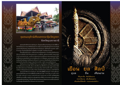
รูปที่ 4 ภาพการจัดอาร์ตเวิร์คแผ่นพับ