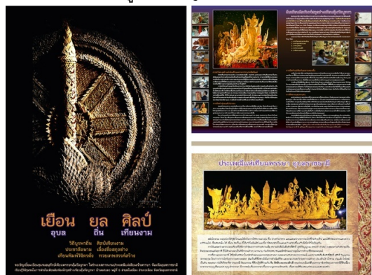
รูปที่ 5 ภาพชุดสื่อสิ่งพิมพ์แบบผสมทั้ง 3 ประเภท

ประเภท ตามรูปแบบที่ออกแบบไว้ แล้วนำเสนอให้ผู้เชี่ยวชาญประเมินคุณภาพด้านการผลิตสื่อ จำนวน 5 ท่าน ประเมินคุณภาพ และดำเนินการปรับปรุงแก้ไขตามคำแนะนำของผู้เชี่ยวชาญ