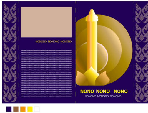
รูปที่ 3 ภาพร่างแบบละเอียด