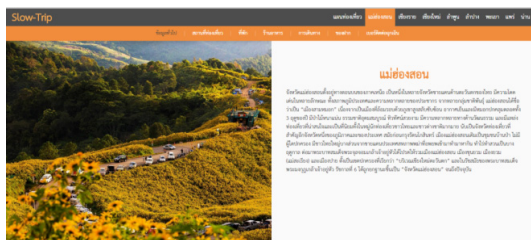
รูปที่ 2 เมนูหลักและเมนูรองของเว็บไซต์